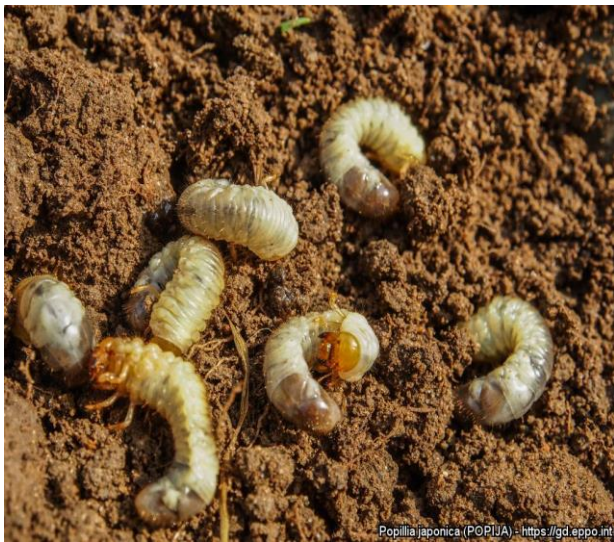
Popillia japonica (POPIJA) - https://gd.eppo.int