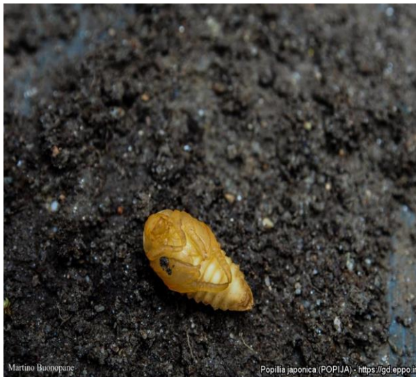
Martino Buonopane Popillia japonica (POPIJA) - https://gd.eppo.int