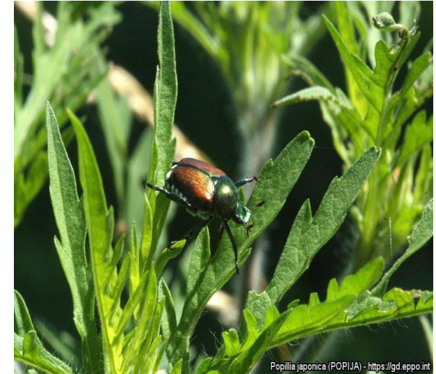
Popillia japonica (POPIJA) - https://gd.eppo.int